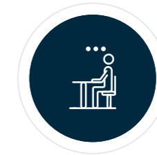
Dzieci i młodzież